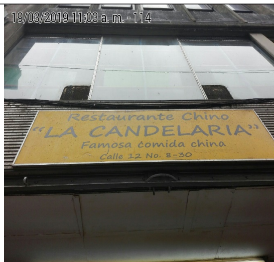
Fotografía No.2 Nomenclatura urbana del establecimiento.