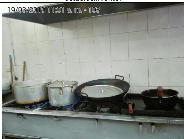
Fotografía No.4 Estufa de 3 puestos y plancha.