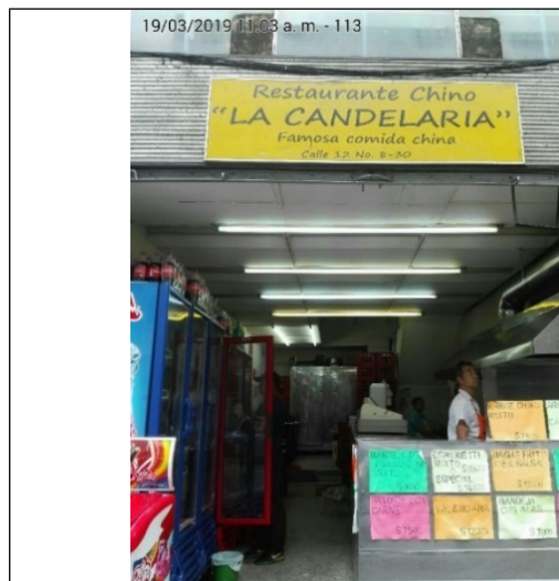
Fotografía No.1 Fachada del establecimiento comercial.