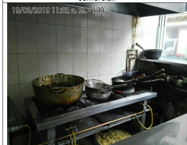
Fotografía No.3 Estufa de 2 puestos